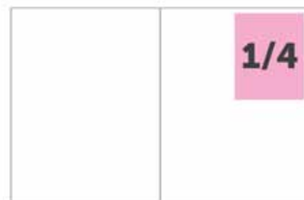
100mm x 132,5mm