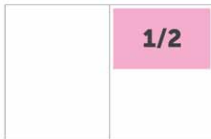
205mm x 132,5mm